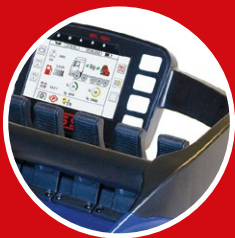
Elektronische Funkfern- steuerungen

Was macht Ihren neuen Ladekran wirklich wirtschaftlich? Ein innovatives, starkes und einfach zu bedienendes Gerät, das mit optionalen Ausstattungen und Zubehör perfekt auf Ihre Einsatzanforderungen angepasst wird. Genau da setzen wir mit unserer FASSI-Zubehöraktion an: Ob elektronische Helfer, Sicherheitseinrichtungen oder Sonderausrüstung für Spezialanwendungen – mit der Bestellung Ihres neuen FASSI-Ladekrans erhalten Sie bis zum 30.06.2021 zusätzliche Ausstattungsoptionen im Wert von bis zu 8'000 CHF.