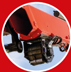
Seilwinde mit automatischer Windenkontrolle