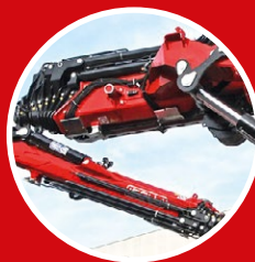
Zusätzlicher Knickarm (JIB) für mehr Reichweite