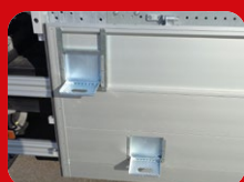
Eléments grimpants utiles dans les parois des rebords