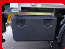
Caisse à outils intégrée