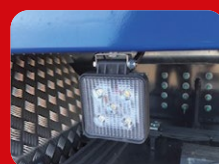
Projecteurs de travail LED