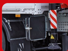
Support de plaque d'appui stable