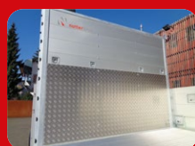
Paroi frontale robuste